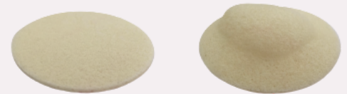
Nursicare® relativamente seco - no es necesario cambiarlo